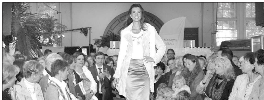
Großes Interesse erregt die Modenschau. Bis zu 2500 Menschen sollen die Messe gestern in der Markthalle besucht haben. Es war die dritte Messe »Rund um die Frau« in Herford.