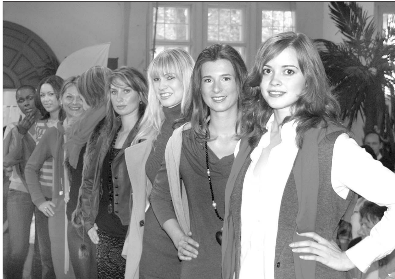
Models der Agentur Catwalk präsentieren Kleidung von Alba Mode aus Bad Salzungen. Doch Mode ist nur ein Teil der